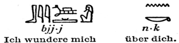
Abb. 7: Ich wundere mich über dich.

Gott Ra durfte seine Angebetete Isis fürderhin mit dem Spruch „Ich glänze durch Liebe zu Dir“ bedrängen. Für die Göttin Isis suchte ich mir passend zu ihrer abwehrenden Körperhaltung den etwas „gschamigen“ Spruch aus: „Ich wundere mich über dich!“