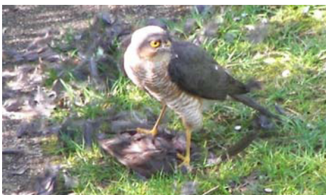
Abb. 2: Sperber im Garten