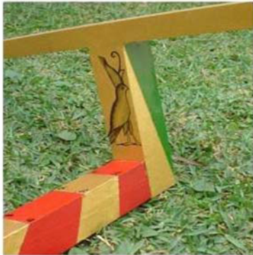
Abb. 15: Horus Detail 1

Der bolivianische Horus lebt auch in einem wesentlich edleren Ambiente als seine „Eltern“ im kleinen Reihenhausgarten in Bremen. Aber es ist wie im richtigen Leben: Mitunter bringen es die Kinder weiter als deren Eltern. Und noch ein Unterschied ist zu vermelden: Da Quijote bei Santa Cruz de la Sierra auf der südlichen Hemisphäre liegt, wandert der Schatten anders als in Bremen über den göttlichen Sonnenuhr-Korpus.