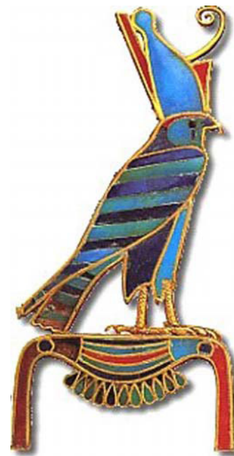
Abb. 3 Falkengott in Farbe

verspeiste. Ich wohne seit nunmehr 23 Jahren in der Kopernikusstraße in Bremen, aber noch nie zuvor hat es so ein dramatisches Greifvogel-Ereignis im Garten gegeben. Zugvögelschwärme jeglicher Größe und Art ziehen im Frühjahr und Herbst übers Haus und es gibt das Jahr über die üblichen städtischen Singvogelbesucher und –Bewohner, aber einen jagenden Falken hat es noch nie im Garten gegeben. Was sollte das bedeuten? Nun, kurze Zeit später wusste ich es: Es war nichts weiter als die magische Ankündigung der bevorstehenden Horus-Falkengott- „Geburt“ in Bolivien!