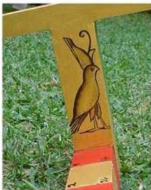
Abb. 16: Horus Detail 2

Horus ist in drei Farben bemalt: Mit der Farbe Grün wird einerseits ein Bezug zu seiner „Mutter“ Isis in Bremen hergestellt, andererseits steht das Grün auch für die üppige Vegetation der Provinz Santa Cruz und als Hoffnungssymbol für ein neues Leben.