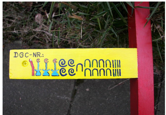
Abb. 11: Das ist die DGC-Nummer für die Isis ...

gehen. Somit sind die beiden Sonnenuhren mit folgenden Nummern beim DGC- Sonnenuhrenarchiv registriert: