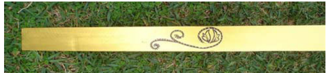
Abb. 18: Streifenbild Feurige Umarmung