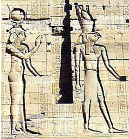
Abb. 1: Horus mit ISIS

Diesen Ohrwurm aus dem Jahr 1960 kennen Sie sicherlich noch! Concetta Rosa Maria Franconero, Tochter italienischer Einwanderer aus Newark, New Jersey, USA hat den Song mit ihrer durchdringenden Stimme gesungen und sämtliche Hitparaden gestürmt: Connie Francis!