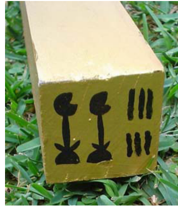
Abb. 17: 2006 in Hieroglyphen

Stundenbalkens ist ein Kompass aufgemalt. Auf der Unterseite ist das Jahr 2006 zu Erinnerung an die Geburt des Horus in Hieroglyphen aufgemalt.