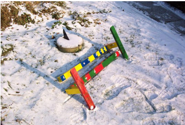
Abb. 10: Isis und Ra im Schnee

Ja und nun lagen die beiden zunächst einmal zur Probe bei Schnee im Garten.