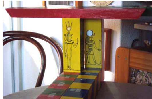
Abb. 5: Nahaufnahme Isis & Ra

Isis, ursprünglich Aset genannt, wird ja gemeinhin mit ihrem Gatten Osiris, dem Totengott, in Verbindung gebracht. Einen Totengott wollte ich mir nicht in den Garten legen und ich fand, dass Ra, „der Hörende, die Mittagssonne“ – der Sonnengott also, eine bessere Partie für Isis wäre.