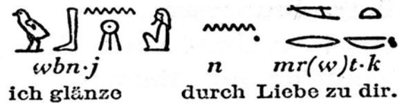
Abb. 6: Ich glänze durch Liebe zu Dir.

Diese beiden so einfach nebeneinander liegen zu lassen erschien mir allerdings etwas zu schlicht und zu passiv. So schaute ich in dem Buch Götter, Gräber und Gelehrte von C.W. Ceram nach, das mir meine Mutter 1954 geschenkt hatte. Ich suchte nach einer geeigneten Hieroglyphen-Inschrift für mein Götterpaar und fand auch zwei sehr gut passende Ausdrücke.