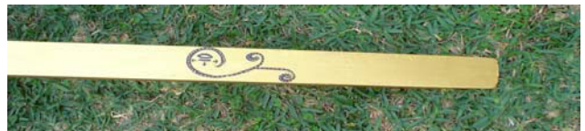
Abb. 19: Streifenbild Te lo diré

...und „Te lo diré“ – „Ich werde es Dir in einer feurigen Umarmung sagen“