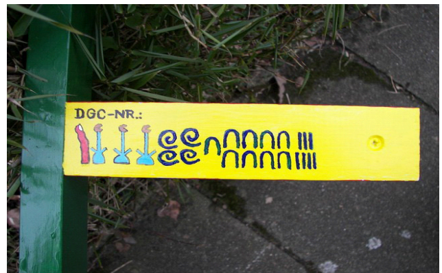
Abb. 12: ... und das ist die Nummer für den Ra.

Nun konnte Ra die Isis mit seinem Spruch „ wbn-j n mr(w)t-k “ bedrängen. Was dies auf Deutsch bedeutet, können Sie oben noch einmal nachlesen. Jedenfalls: Es „funkte“ zwischen den beiden und schon im Monat Juni kam der Sohn Horus in Bolivien zur Welt!