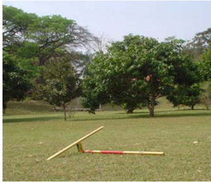
Abb. 14: Horus in Quijote

Der bolivianische Horus lebt auch in einem wesentlich edleren Ambiente als seine „Eltern“ im kleinen Reihenhausgarten in Bremen. Aber es ist wie im richtigen Leben: Mitunter bringen es die Kinder weiter als deren Eltern. Und noch ein Unterschied ist zu vermelden: Da Quijote bei Santa Cruz de la Sierra auf der südlichen Hemisphäre liegt, wandert der Schatten anders als in Bremen über den göttlichen Sonnenuhr-Korpus.