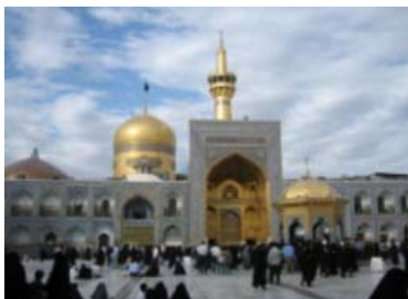
Holy Shrine de Imam Reza Mashad.