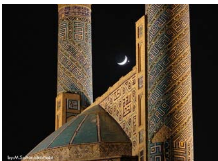
La mosquée Jaame Abbasi également appelée mosquée Shah ou mosquée Emam, à Isfahan

Si vous regardez dans un livre sur les mosquées Iraniennes ou allez sur Internet vous trouverez des milliers d'images pittoresques comme cette photo ci-dessous, réalisée par Mohamad Soltanolkottabi et que mon ami Iranien Mashallah Ali-Ahyaie m'a envoyée l'année dernière : Vénus sur le point d'embrasser la Lune !