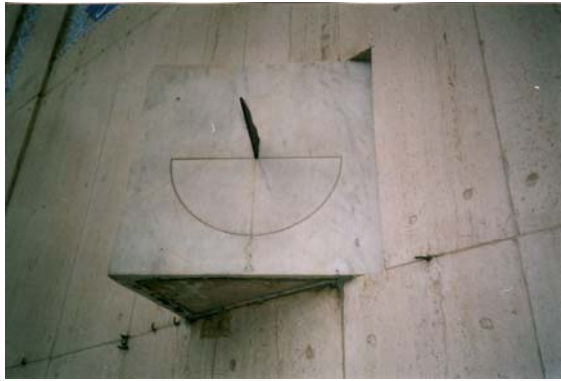
Une autre photo: Mohammad Bagheri

Le marqueur de midi suivant m'a beaucoup fasciné par sa forme différente comparée à celles des autres indicateurs de midi, par la beauté positive de son charmant texte et par son créateur. Il est situé à Chahār Bāgh (quatre jardins) et appartient à une école religieuse. Le bâtiment derrière n'est pas une mosquée. Le mur a une orientation Est-Ouest.