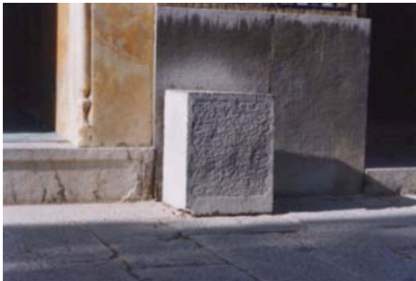
Marqueur de midi de Chahār Bāgh.

Le marqueur de midi suivant m'a beaucoup fasciné par sa forme différente comparée à celles des autres indicateurs de midi, par la beauté positive de son charmant texte et par son créateur. Il est situé à Chahār Bāgh (quatre jardins) et appartient à une école religieuse. Le bâtiment derrière n'est pas une mosquée. Le mur a une orientation Est-Ouest.