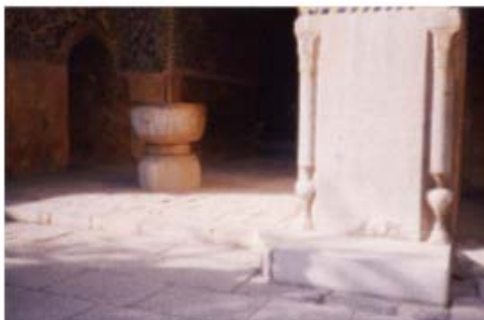
Marqueur de midi de Friday Mosque d' Isfahan.

L'indicateur de midi est situé sur l'un des nombreux portails de la mosquée du vendredi d'Isfahan, aussi appelée la mosquée Jame.