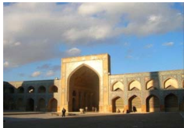
Vue extérieure de la mosquée Jame ou Friday mosque of Isfahan.

Dans cette mosquée, je voudrais vous montrer un petit trésor : Un double indicateur de midi, calculé avec précision et d'une absolue simplicité !