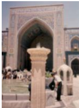
Un marqueur de midi sur une colonne, près d'un bassin en face de Holy shrine de Imam Reza Mashad.