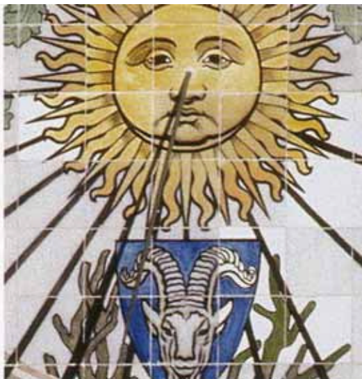
CASA TERRADES, Barcelona

Sonnenuhren sind immer auch ein vorzüglicher Gradmesser und Katalysator der Kultur eines Volkes, einer Region. Wie hält man es mit den überkommenen Schätzen? Lässt man sie verkommen oder erkennt man deren Bedeutung und unternimmt etwas zu deren Bewahrung? Gibt es Neuschöpfungen? Wie sehen sie aus? Führen sie nur die überkommene Tradition fort oder entstehen neuartige Gebilde?