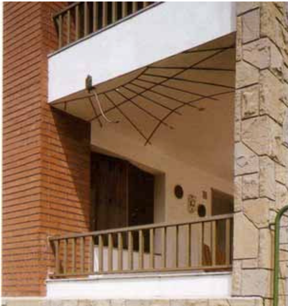
CASA LLADÓ CASABLANCAS, Vacarisses

Abgerundet wird das Buch durch einen kleinen theoretischen Exkurs über die Gnomonik, ein Glossar, eine kleine Bibliographie und einen Index der abgebildeten Werke.