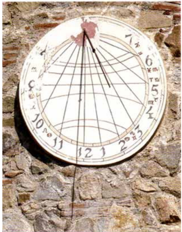
RESTAURANT HORT DE LES MONGES, Cabriils

RELOTGES DE SOL de Catalunya. UN PATRIMONI PER DESCOBRIR. ISBN 84-95550-40-7