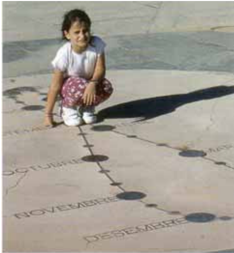
PRAT GRAN DE L'ARENYS, Encamp]

„Rellojges de Sol“ – so heißen die Sonnenuhren auf Katalanisch. In Spanien gibt es zwei voneinander unabhängig arbeitende Sonnenuhren-Gesellschaften. Societat Catalana de Gnomonica , die katalanische Gesellschaft, hat im Dezember 2004 ein fulminantes Buch über Sonnenuhren der Region Katalonien herausgegeben. Schon bei dessen erstem Durchblättern muss man schlicht begeistert sein!