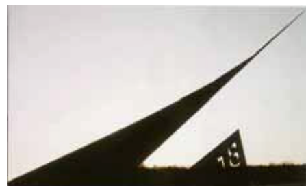
RONDA DE LA FARINERA, Mollet del Valles

Aus deutscher Sicht ist anzumerken, dass es auch zwei edle Objekte aus der Sammlung des MUSEUM HUELSMANN aus Bielefeld zu sehen gibt. Aus Österreich ist eine Klappsonnenuhr von Georg von Peuerbach aus dem Landesmuseum Joanneum in Graz abgebildet. Dazu möchte ich gern eine kleine, reizvolle Geschichte bei der nächsten Jahrestagung des Arbeitskreises Sonnenuhren im Mai in Bonn erzählen.