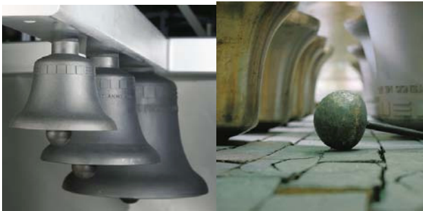
Glockenspiel – die Welt ist Klang

senschaften. Deshalb ist eine Broschüre entstanden, die zu dem neuen Festo Harmonices Mundi die zum besseren Verständnis notwendigen Informationen vermittelt.