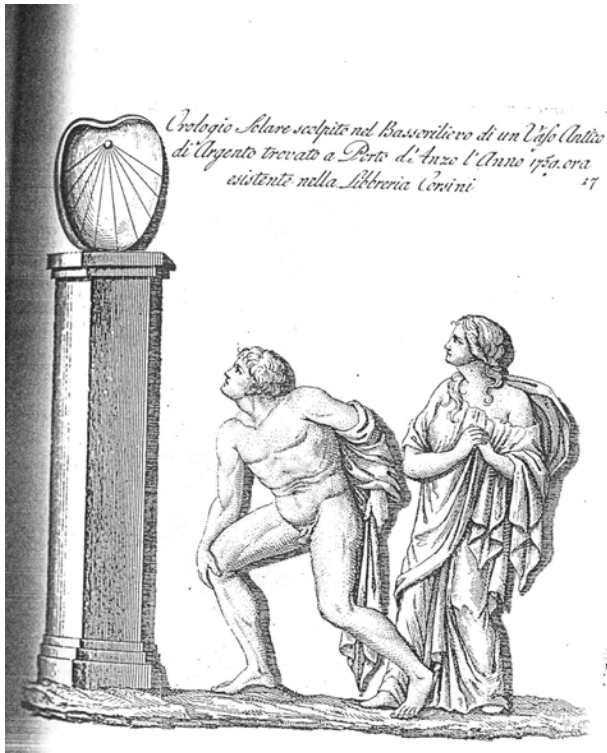
Abb. Römischer Sklave holt die Zeit

namen Heliotrop auf den Markt brachten, wird berichtet, dass Aristarchos von Samos um 250 vor Christus solche Sonnenuhren baute und ihnen den Namen Skaphe gab. Unter dieser neuen Bezeichnung wurden hierauf alle Hohlkugel-Sonnenuhren subsumiert. Später wurden in Italien, Griechenland und Ägypten Skaphen gebaut, deren Uhrenfläche nicht mehr kugelförmig war, sondern den Mantel eines Kegels abbildete und dessen Achse zum Himmelspol gerichtet war. Die Anfertigung der konischen Innenfläche war einfacher und damit auch billiger.