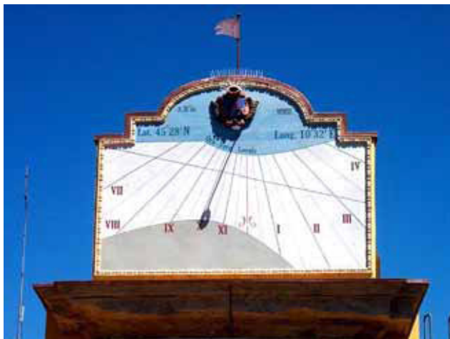
Desenzano Del Garda Palazzo Comunale